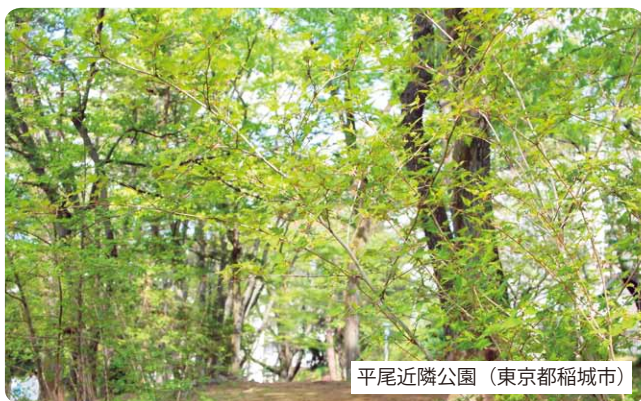
平尾近隣公園（東京都稲城市）